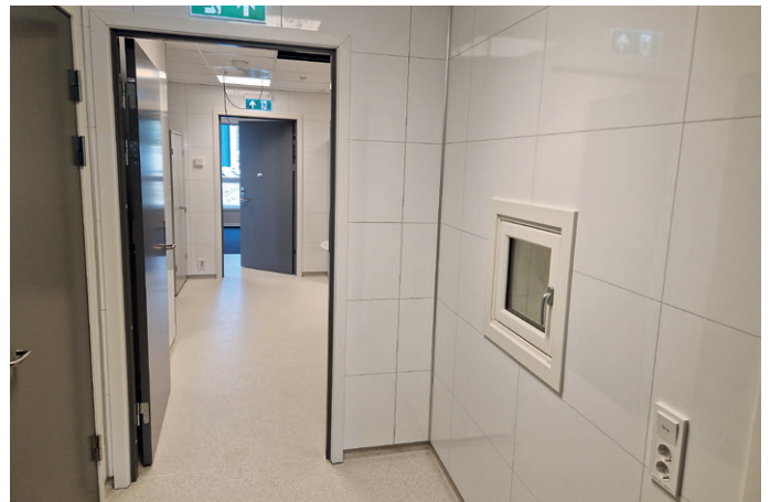
Inngang til vaskerom.