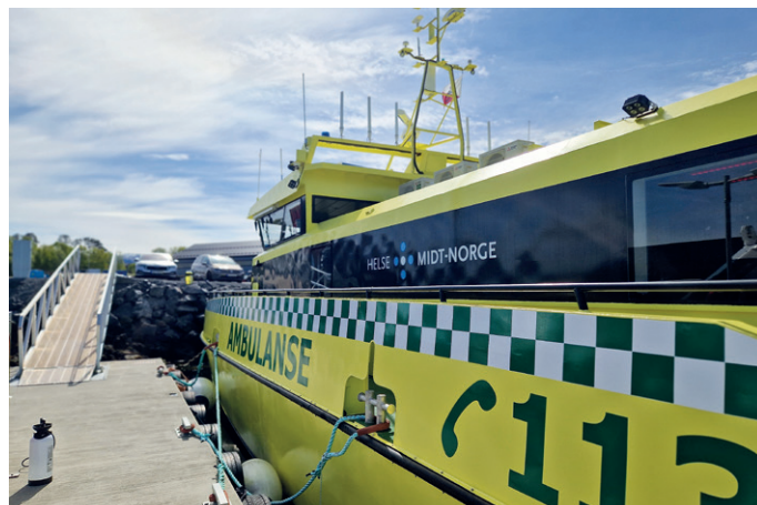
Det er bare 100 meter fra kaia til ambulansébåten og til ambulansestasjonen.