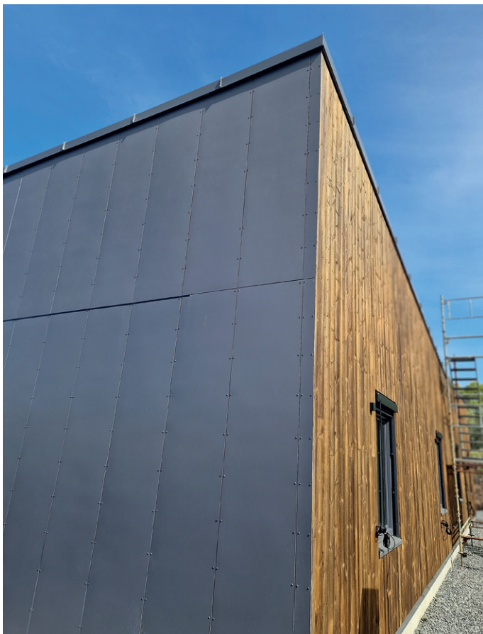
Deler av fasaden der det er brukt både fasadeplater og royal-impregnerert kledning.