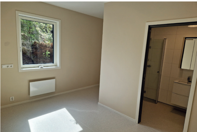
Et av soverommene. Alle har eget bad.