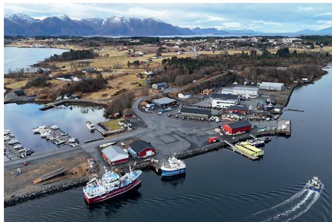
Det er kort vei fra ambulansébåten som ligger midt på bildet til ambulansestasjonen i bakkant av industriområdet.