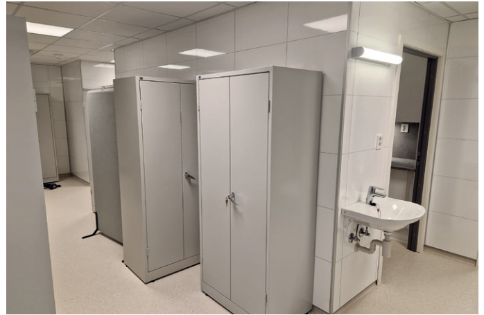
Garderoben der skapene er flyttbare for å lagge skillevegg mellom herre- og damegarderobe.