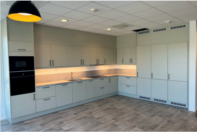
Kjøkkenet i det store åpne oppholdsrommet med stue.